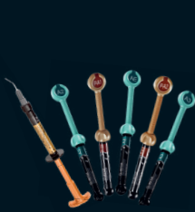
G-aenial™ Family G-aenial Universal Injectable

... die erfolgreichen Restaurations- und Befestigungssysteme von GC!