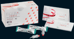
EQUIA Forte™ HT