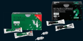
GC Fuji™ IX GP FAST GC Fuji II LC