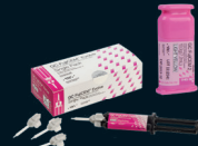
FujiCEM™ 2 SL FujiCEM Evolve