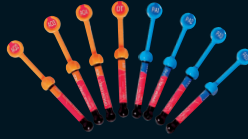
GRADIA® DIRECT Family