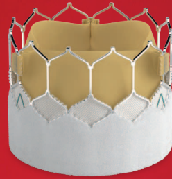
SAPIEN 3 Ultra RESILIA Valve