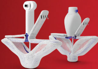
PASCAL Precision Transcatheter Valve Repair System